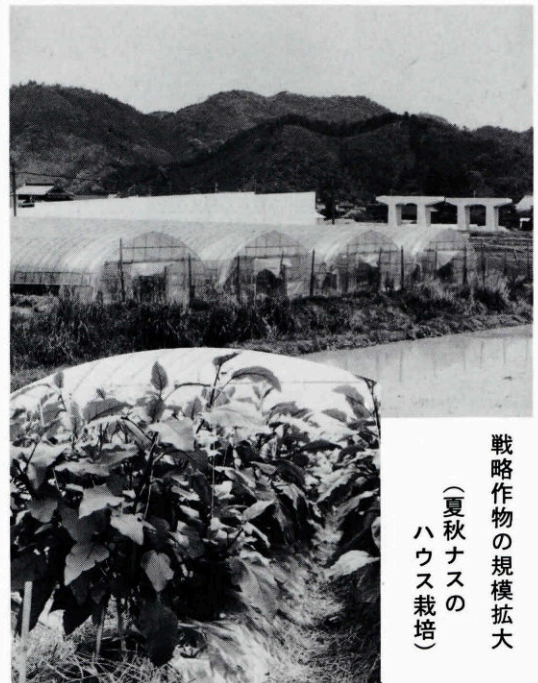
戦略作物の規模拡大 (夏秋ナスの ハウス栽培)