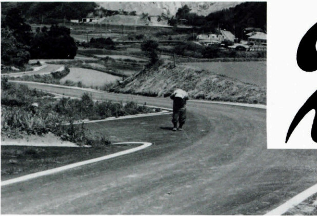
団体営農道整備事業（6,289 m）