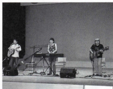
▲新成人にエールを送るべすば