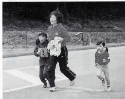
▲ちびっこもがんばりました！