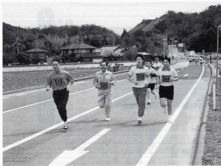
▲さわやかな春を感じた1日でした