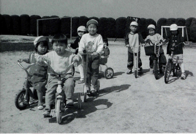
児童保育の健全育成を図ります

児童福祉につきましては、出生率の減少により各保育所とも慢性的な定員割れの状況が続いており、保育所運営及び児童保育に支障をきたす状況であり、このため町議会並びに関係者各位のご理解のもと、児童保育の健全育成を図