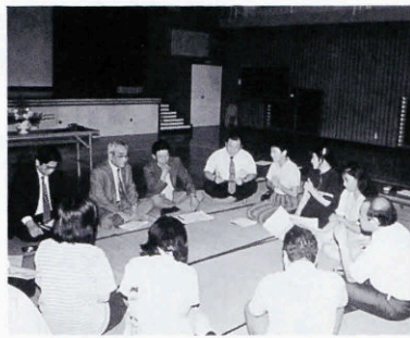
▲1 昨年の地区懇談会のようす。

学校教育推進について (関係地区のみ) 問合せ先 ■油谷町教育委員会 学務課 ☎32・2546