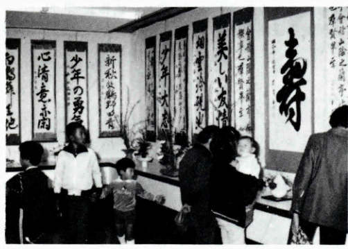
油谷農協での文化祭