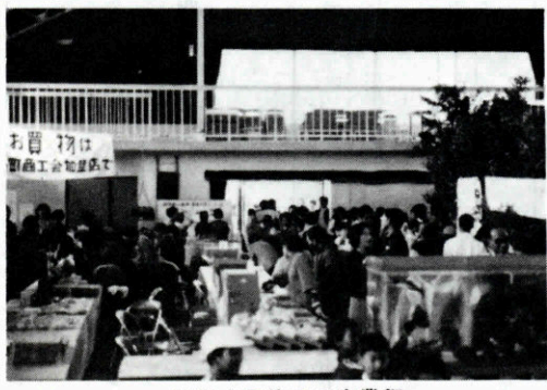
油谷小屋体での産業祭

心配された雨もあがり、去る一月三日体育・文化・産業祭が好天のうちに盛大に開催されました。午前六時の煙火を合図に体育祭の開催をつけ、八時四〇分油谷小学校鼓笛隊のトランペットファンファーレにより入場行進が開始され、開会式の後油谷小グラウンドにおいて各チームの出場者による熱