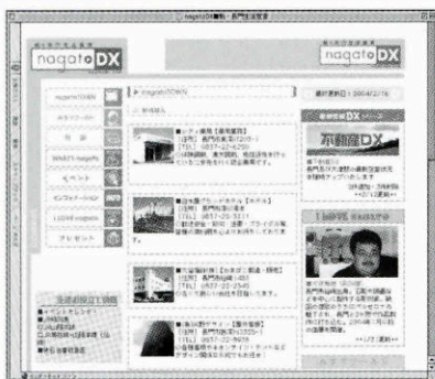
nagato DX のトップページ