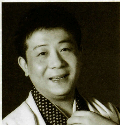
しゅんぷうてい こあさ 春風亭小朝 (落語家)

昭和30年東京駒込生まれ。春風亭柳朝に入門後、25歳で真打昇進。落語以外にもドラマ、クラシック音楽、JAZZと様々な活動を展開。年間200回を超える独演会、講演会を行い、特に歌舞伎座三夜連続独演会、銀座博品館劇場30日間連続独演会など大劇場の公演が多い。平成9年10月には落語会初の日本武道館での独演会を開催し、大作を2席口演し大好評を博す。著書に「言葉の嵐」(筑摩書房)、「苦悩する落語」(光文社ルッパ・ブックス)など