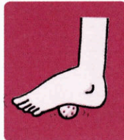
足裏のマッサージにはゴルフボールなどを利用すると効果的です