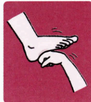
手を握り第二関節の出っ張りを利用して刺激します