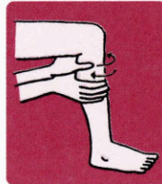
ふくらはぎなどは両手で筋肉をつかみ両手でこねるようにします