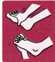
足の指と手の指で握手して、足の指を広げます