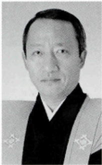
吉田箕太郎改め 三世桐竹勘十郎