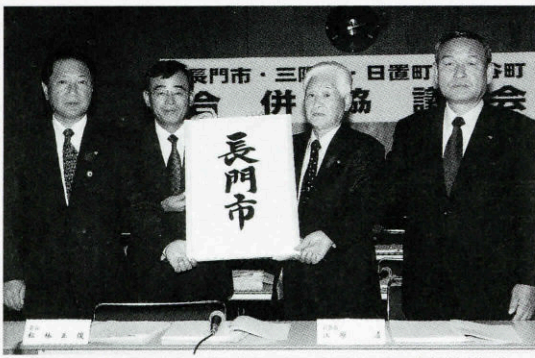
新市名称「長門市」を掲げる4市町長（第10回合併協議会）

この内、合併協定基本4項目と呼ばれる「合併の方式」、「合併の期日」、「新市の名称」、「事務所の位置」については、それぞれ「新設合併」、「平成17年3月22日」、「長門市」、「現長門市役所」と決まり、平成17年3月22日には新しい「長門市」が