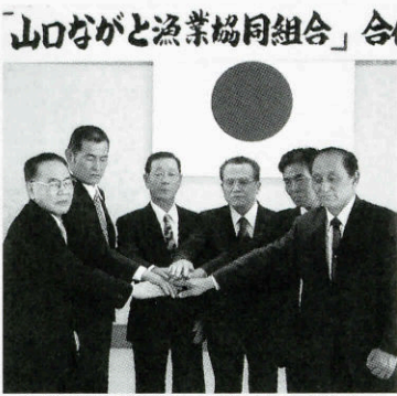
合併契約調印が終わり握手する6組合長

漁協合併は、平成11年に圏域の全14漁協が参加した合併協議会を設置して合併協議を開始。平成12年1月に9漁協（通・湊・野波瀬・小島・津黄・立石・伊上・掛淵・久原）が先行合併して旧山口ながと漁協が発足。4月17日に残り5漁協との合併契約調印が行われました。