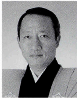
吉田 簀太郎 改め 三世 桐竹 勘十郎

● 入場料（全席指定） 1階席 3、500円 2階席 2、500円 3階席 1、500円 ● 座席（6名） 17、500円