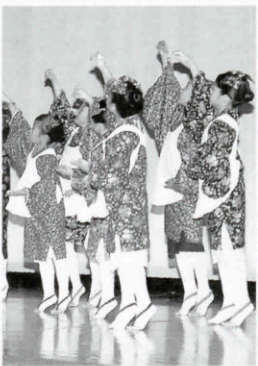
みずゞの世界を舞踊で表現