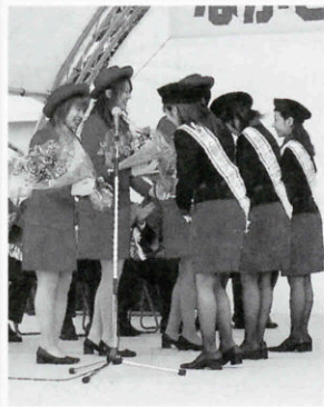
観光アテンダント2年間お疲れ様