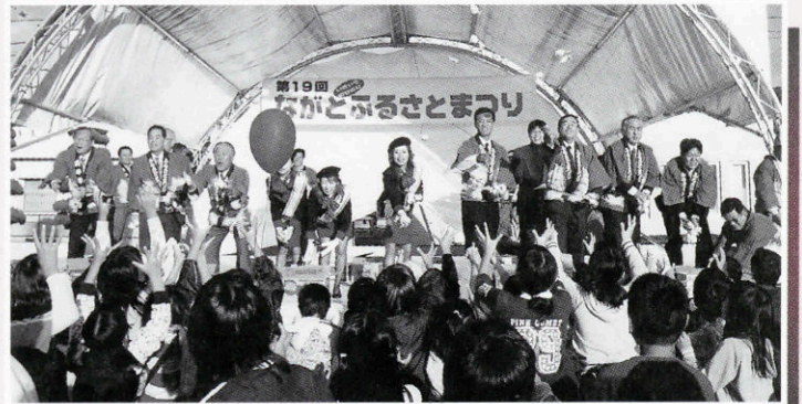
「こっち! こっちい~!!」(ふるさとまつり恒例のもちまき大会)