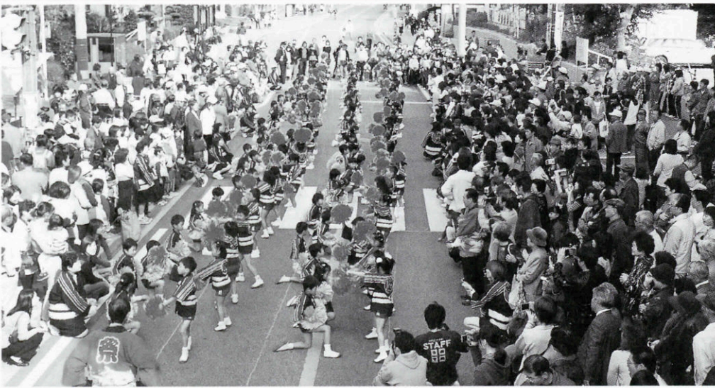
市内幼稚園・保育園児約120人参加による幼年消防クラブパレード

10月26日、長門市役所周辺で「第19回いきいきのびのびながとふるさとまつり」が開催され、大勢の人出でにぎわいました。会場内には地元特産品を販売する物産展や各種バザー、フリーマーケットなどがオープンし、お宝鑑定INながとやマジックショー、芸能大会、綱引きなどがまつりを盛り上げました。まつりの最後を飾る市民総踊りには8団体、約250人が参加して華やかな踊りを披露しました。