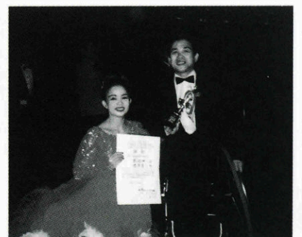
▲幕張メッセで受賞記念に

方へ毎週出かけます。大会に入賞出来たのは、賞にはこだわらず楽しかったら良いと言う気持ちで。今後はインストラクターの資格を取って、車いすダンスの普及に努めていきたい。」と話しておられました。