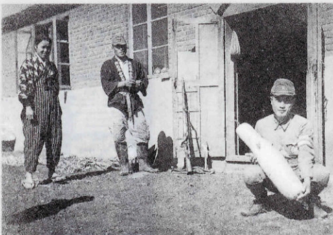
中国への無銭旅行をしたときのひとコマ

最後に、「まず歩くこと。朝夕、ゴミ袋片手に歩くことや、朝風呂(湯本)に入ることが、健康の秘訣」と話してくれました。