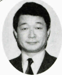
吉川アナウンサー