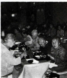
▲食事をしながらショー見物