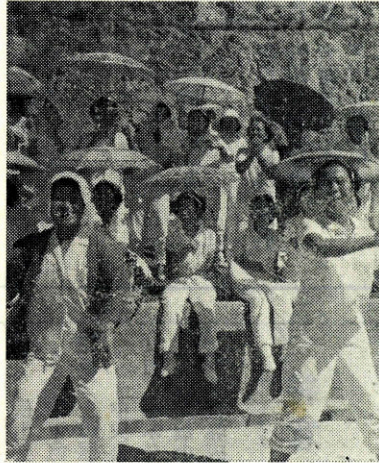
第二回市連合婦人会体育祭が秋晴れの9月5日、赤崎山スポーツ遊園地で開かれました。集まったママさん約1000人は深川、仙崎、俵山、通の四地区に分かれ玉入れ、アベツク競走、つな引き、リレーマスゲーム(百年桜)などくりひろげ楽しい一日を過しました。