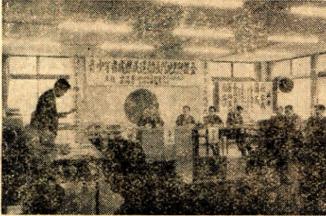
（青少年育成懇談会）