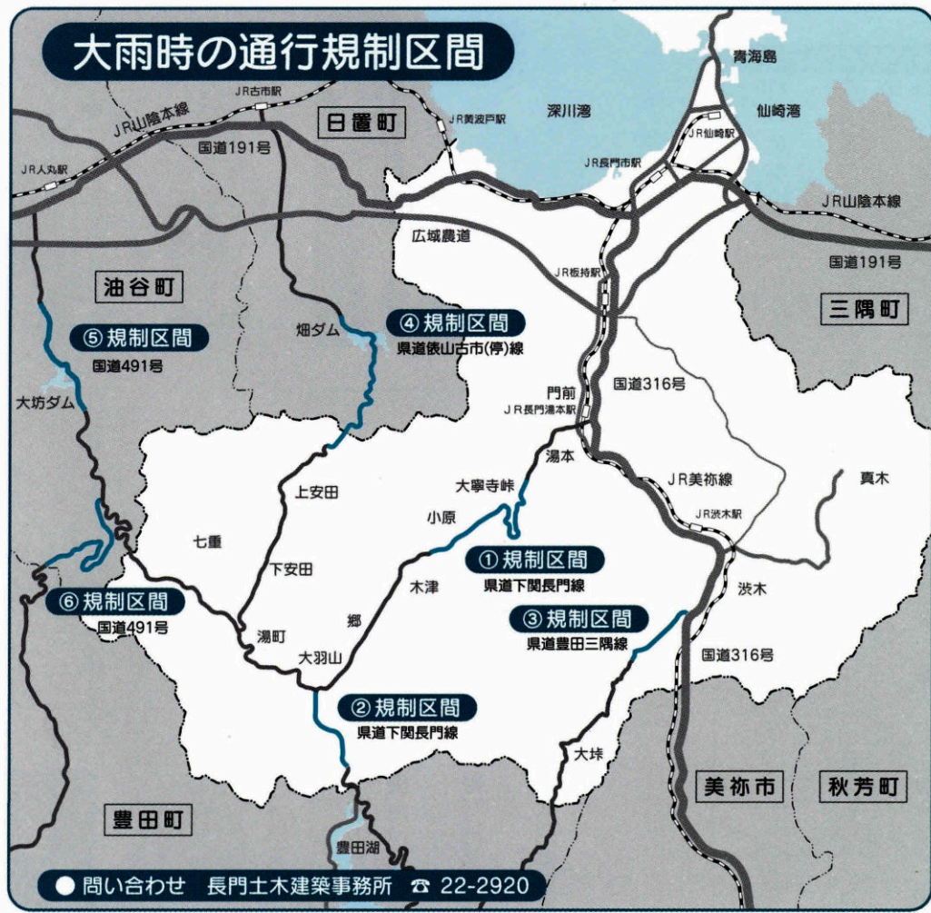
■ 大雨時の通行規制区間と規制基準雨量 (単位: mm)

梅雨シーズンになりました。山口県が管理する県道下関長門線など4路線6区間では、大雨が降った時に落石や土砂崩れにより危険となるため、降雨量が規制基準以上になった場合には、災害による事故を未然に防止することを目的として通行止めを行う区間が指定されています。皆さまのご協力をお願いします。大雨が降りそうな時は、道路情報などに注意して道路をご利用ください。