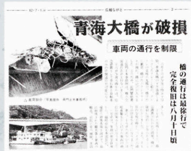
▲青海大橋にクレーン船衝突 (611号・昭和62年7月1日発行)