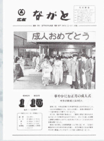
▲600号(昭和62年1月15日発行)