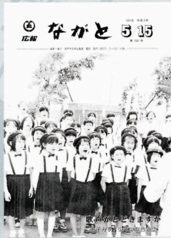
▲700号(平成3年5月15日発行)