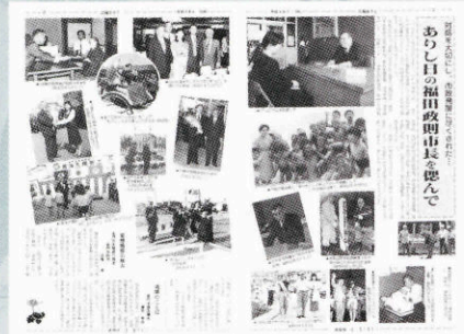
▲故福田市長を偲ぶ(721号・平成4年4月15日) [当時では異例の2ページ見開き特集]