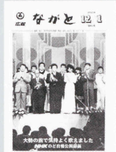
▲NHKのぞ自慢公開録画 (621号・昭和62年12月1日)