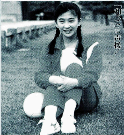
▲「和っ金のメダル」特集号(平成元年7月1日)