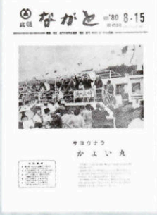
▲ 通渡船廃止 (453号・昭和54年8月15日)