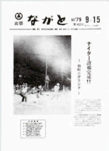
▲ 仙崎小に夜間照明設備 (432号・昭和54年9月15日)