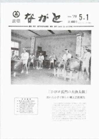
▲ 400号 (昭和53年5月1日発行)