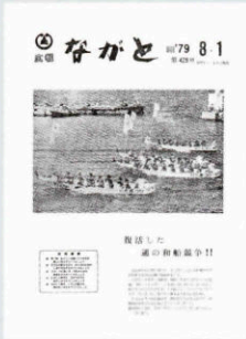
▲ 通の和船競漕が復活 (429号・昭和54年8月1日)