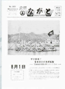
▲ 青海島小児童イカダ航海 (383号・昭和52年8月1日)