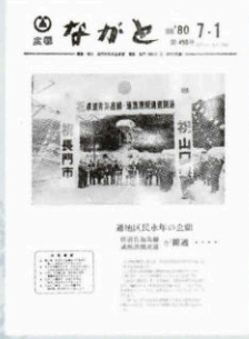
▲ 県道青海島線開通 (450号・昭和54年7月1日)