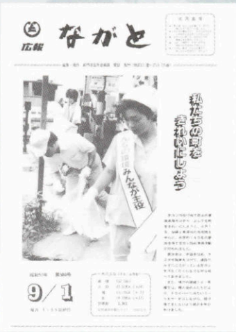
▲ 500号 (昭和57年9月1日発行)