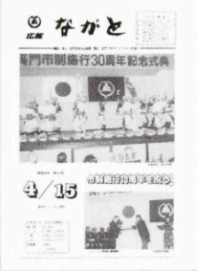
▲ 市制施行30周年記念式典 (537号・昭和59年4月15日)