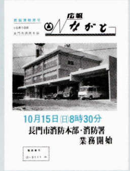
▲ 消防署特集号(初の2色刷) (号外・昭和47年10月10日)