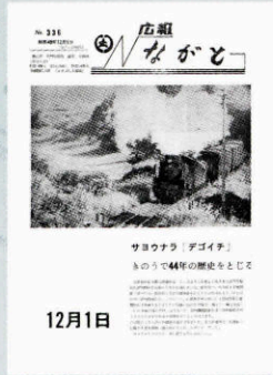
▲ 山陰本線S L廃止 (336号・昭和49年12月1日)

高度経済成長期を迎え、長門市も公共施設や道路等の整備が進み都市としての形を成してきます。広報も昭和42年から名称を「広報ながと」に変更し、表紙が写真になりました。また、昭和51年度からは月2回の定期発行（1日・15日号）になるなど、現在の発行スタイルが確立しました。