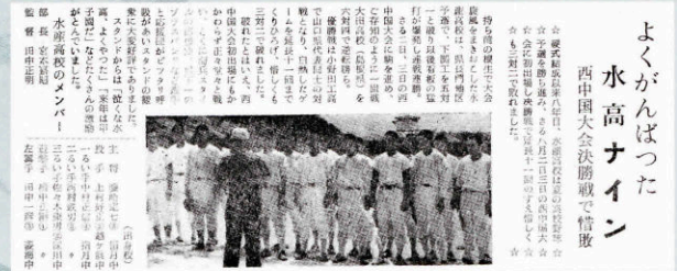
▲ 水産高野球部・西中国大会決勝で惜敗 (220号・昭和40年8月11日)