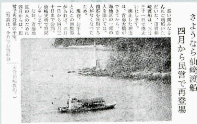
▲ 仙崎渡船廃止 (230号・昭和41年3月29日)