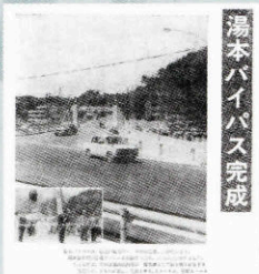
▲ 湯本バイパス開通 (245号・昭和42年5月1日)