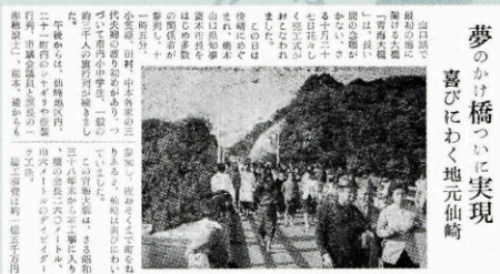
▲ 青海大橋開通 (224号・昭和40年11月9日)