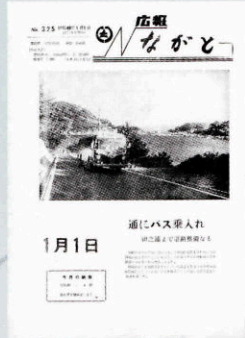
▲ 通にバス乗り入れ (325号・昭和49年1月1日)