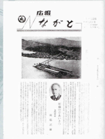
▲ 長門市広報から「広報ながと」に (241号・昭和42年1月12日発行)