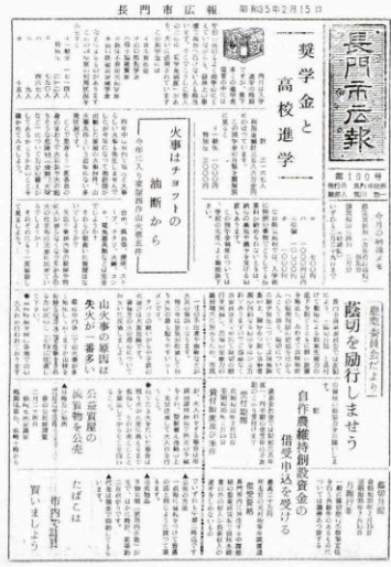
▲ 100号 (昭和35年2月15日発行)