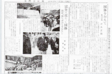
▲ 国体開催 (189号・昭和38年11月18日)