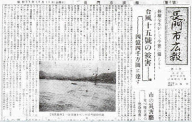
▲ 初めての写真 (6号・昭和29年10月15日)