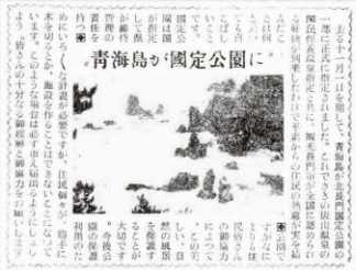
▲ 青海島が国定公園に (20号・昭和30年11月15日発行)