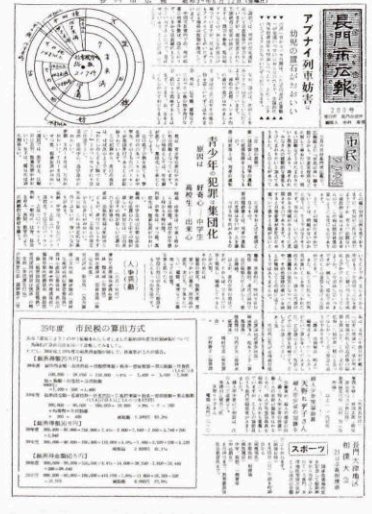
▲ 200号 (昭和39年6月12日発行)