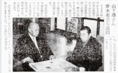
▲ 裸の大将・放浪の画家「山下清」来庁 (195号・昭和39年3月6日発行)