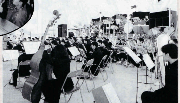
ブラスバンド演奏

町民のみなさんがトントンと肩をたたきあいながら、みすみの発展をトントンと進めようと、今年のキャッチフレーズも「とんとんフェスタinみすみ」。今年が目玉は、町民の手づくりイベントです。どうぞゆっくりお楽しみください。