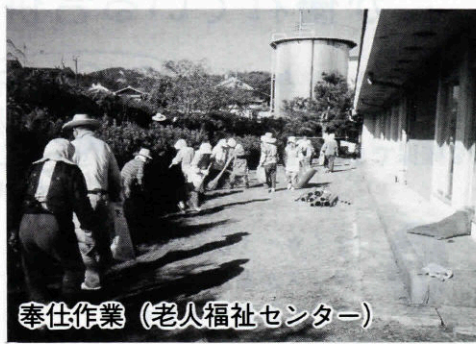
奉仕作業 (老人福祉センター)