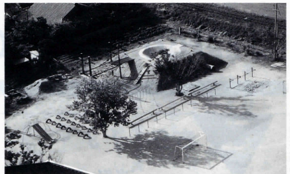
▲育友会「汗の結集・遊具」

本校では、父母、地域の人々と連携し、21世紀をたくましく豊かに生きる浅田っ子の育成を旨とした様々な活動を行っています。