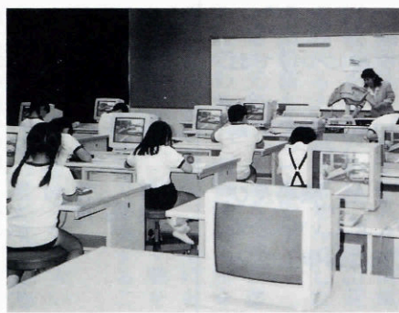
▶情報化時代の コンピュータ教育

第二に、家庭教育関係では、一昨年、昨年と育友会が「汗の総結集」をして「力山」に「すべろープ」を連結し完成しました。児童に力を合わせることの大事さを親が身をもって示したのです。