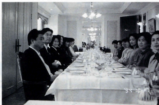
▶研修視察でフランス料理

更に昨年度は育友会でフランス料理についてのマナーを学び、本年は日本の懐石料理のマナー等を学習し、地域に根ざした国際理解教育の一助にするつもりです。