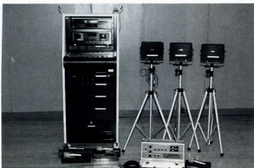
▼改善された放送機器(左：屋内用・右屋外用)

このたびの屋内用機器は、出力・音質ともアップし、各種大会等の利用に大変効果を発揮できることと思います。また移動可能な屋外用は、各自治会での運動会やスポーツ大会に活用でき、これにより住民の親睦の輪が広がることを期待されます。