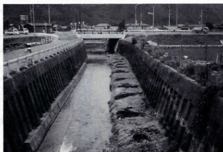
▲旧バイパス附近の大竹川(河口附近)

私達の生活に憩いとうるおいを与える水と緑のオープンスペースとして親しまれ利用されてきた河川が、ごみの不法投棄や汚濁水の放流等によりその美しさが損なわれ、さらには海域にまでその影響を及ぼしています。