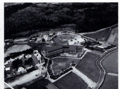
▲上空から見た保養所

湯免に建設中の(株)中電工湯免保養所が丸一年をかけ完成し、6月16日に竣工式がありました。6725㎡の敷地に鉄筋コンクリート3階建1817㎡の保養所で40名の泊り(中電工職員のみ)ができ、町の活性化につながると思います。