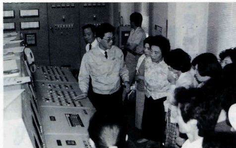
▲清掃工場で現地研修する婦人会

ごみの中には、わたしたちの工夫でごみにならずに済むものや、もう一度資源となって生まれ変わるものがたくさんあります。町民の方、事業者の方および行政が一体となってごみを減らし、ごみをよみがえらせるための工夫をしていくことが、これからの地球、地域の生活環境を守っていくためには必要なのです。