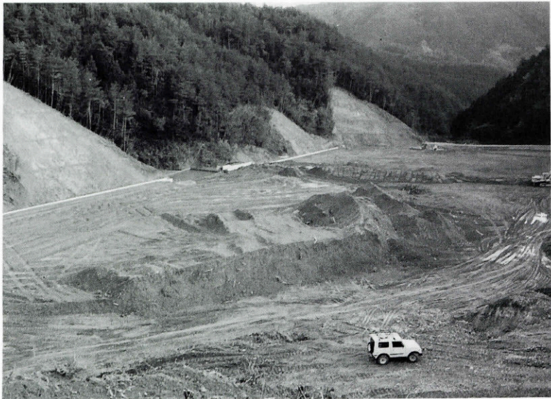
草地開発整備事業