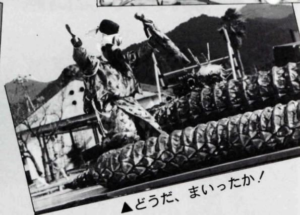
▲どうだ、まいったか!