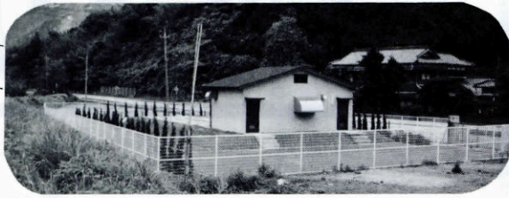
ふるさとの川をいつまでも美しく