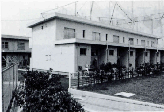
公営住宅新築6戸 殿村新開