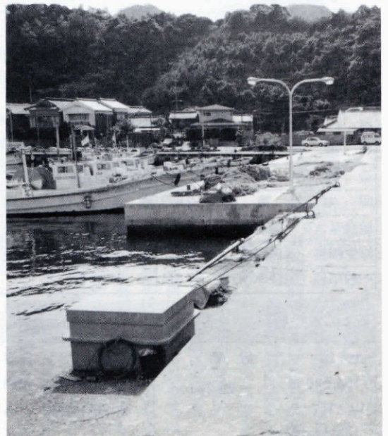
野波瀬漁港局部改良