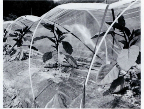
新たな戦略作物 夏秋ナス