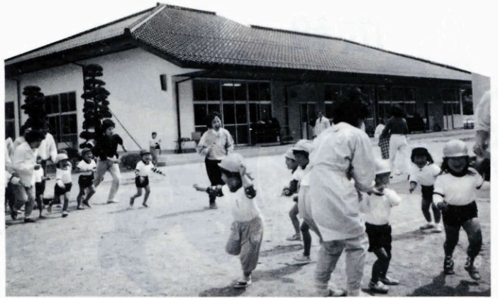
オープンスペースを生かした宗頭幼稚園舎