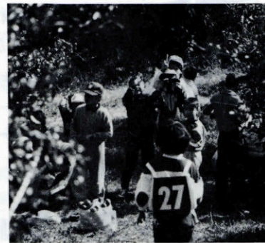
▲みかんの味はどうだったかな

以前全町民を対象に行われていた「歩こう走ろう大会」を、二年前から、町内三会場に分け、各ブロック体育部によりそれぞれ地域の特色を生かした大会を企画してきました。今年度は、上地区で生島への「みかん狩り」、中地区では豊原自治会内をクイズを解きながらふるさと探訪するウォークラリー。下地区では、「鉄割山」登山と、ユニークな企画で、参加された皆さんは、ここち良い汗を流しました。