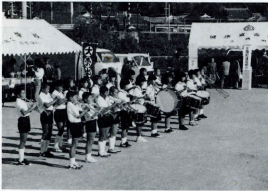
▶ 明倫小マーチングバンド演奏