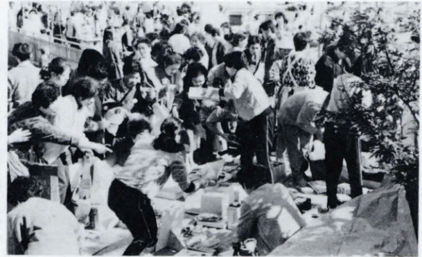
▶ バザーや不用品売場は大盛況