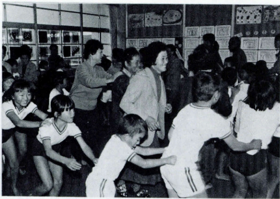
▲ 笑い声の絶えなかったゲーム遊び