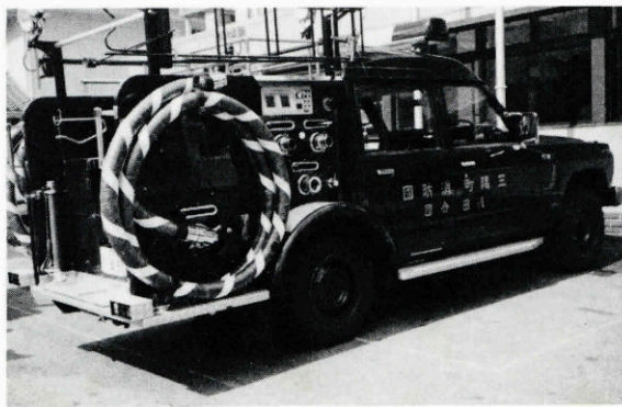
▲更新された浅田分団消防ポンプ車