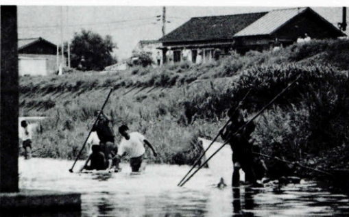
▶ただいま順調に航行中

り、約九〇〇個のパックが集まりました。 八月二十一日、いよいよ牛乳パックのイカダの進水式、川の上の多くの見物人の見守る中大喚声とともに見事に発進。市「琴影橋」土手の三隅中学校前までの約五〇〇Mの航行ですっかり気分はロビンフッドの様でした。