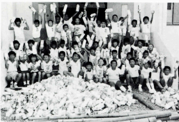
▶さあ、いまからイカダ作るゾ

◎野波瀬自治会高校生二十一名が八月一日夕方、会合を行い高校生の社会参加について、子ども会の世話、奉仕活動の参加に協力することを決めました。 ※今日、高校生についての問題行動がとりざたされていますが、このように自ら育つ、周囲も育てるといふ心づもり、気配りがあるかぎりすばらしい三隅、立派な社会ができることでしょう。