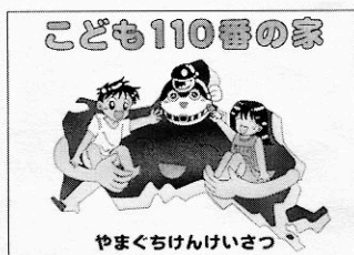
「こども110番の家」のプレート