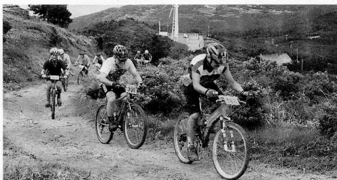
ゴールを目指して 「ラストスパート」